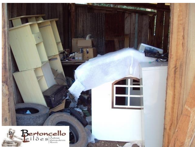
Lote 09: Sucatas de móveis: R$ 100,00