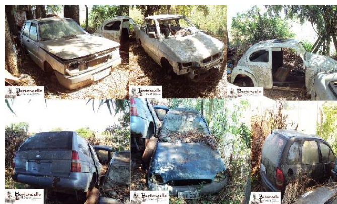
Lote 10: Seis sucatas de veículos: R$ 834,00