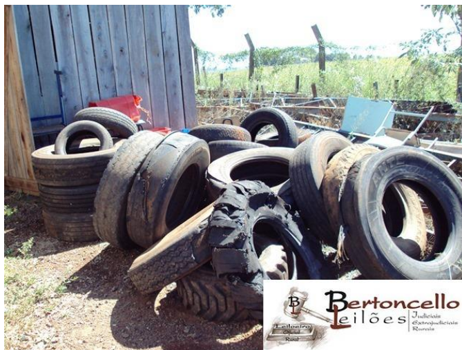
Lote 08: Sucatas de pneus (aprox 50): R$ 50,00