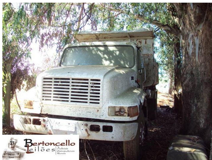
Lote 11: Caminhão Navistar Internacional, ano 1999: R$ 6.000,00.

Edital completo e fotos, cadastre-se no site www.agenciadeleiloes.lel.br