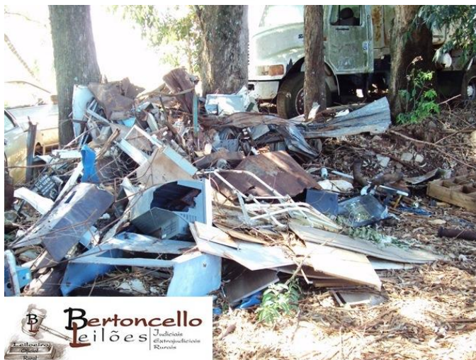
Lote 07: Aprox. 2.500kg sucatas: R$ 200,00